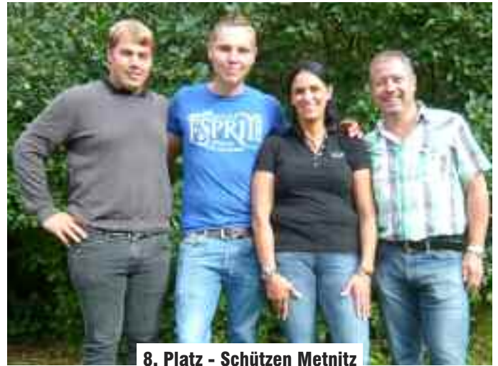
8. Platz - Schützen Metnitz

Diese Distanz kann sich allerdings verlängern oder verkürzen, wenn ein Spieler die Daube trifft und sie weg geschleudert wird. Bei jedem Spiel werden mehrere Kehren (unter Kehren versteht man die einzelnen Wurf-durchgänge gegen einen Gegner) geworfen. Die Mannschaft die am Ende der Kehre die meisten Eisen näher an der Daube, als die gegnerische Mannschaft hat, bekommt die entsprechenden Punkte. Für ein Eisen 3 Punkte, für zwei Eisen 5 Punkte, für drei Eisen 7 Punkte und für 4 Eisen 9 Punkte. Am Ende des Spieles werden die Punkte zusammen gezählt und die Mannschaft die am schnellsten 25 Punkte erreicht, hat dieses Spiel gewonnen.