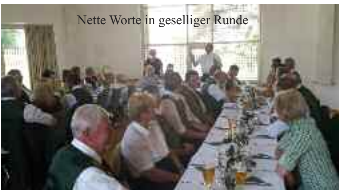
Nette Worte in geselliger Runde