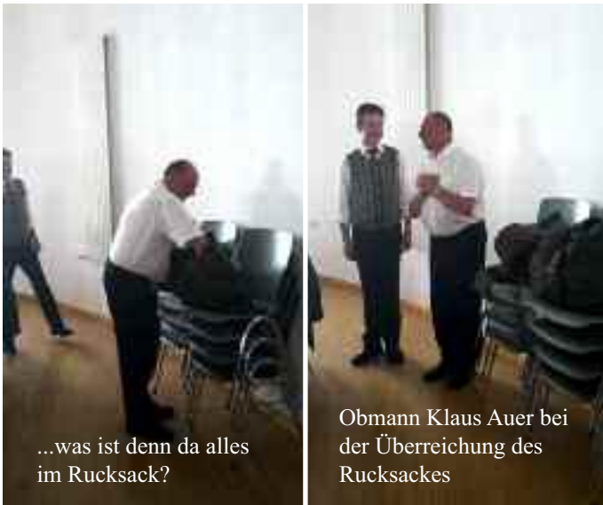
...was ist denn da alles im Rucksack?