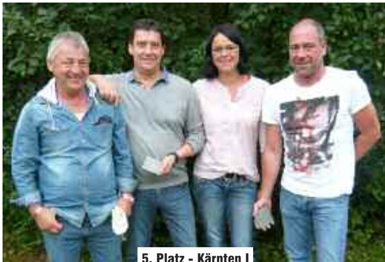
5. Platz - Kärnten I