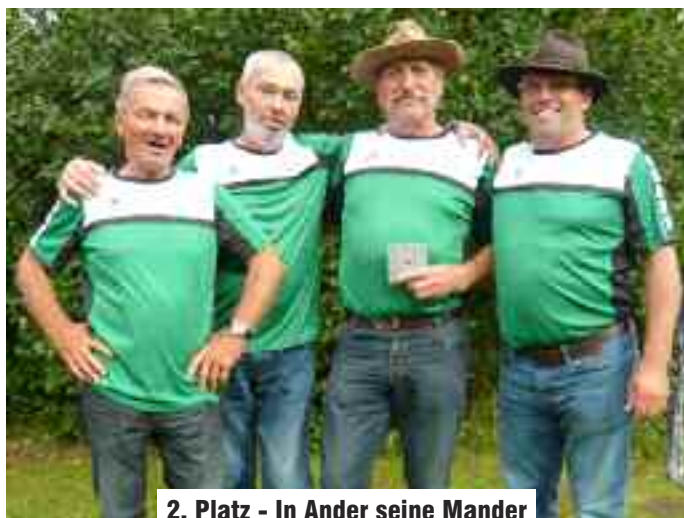
2. Platz - In Ander seine Mander

Der Einladung sind neben 4 Mannschaften aus dem Metnitztal auch 2 Mannschaften aus Tirol und 2 Mannschaften aus dem Pinzgau gefolgt. Auffallend dabei ist, dass mittlerweile immer mehr heimische Mannschaften an dieser Sportart Gefallen finden. Diese Entwicklung trägt in jedem Fall dazu bei, dass es hoffentlich noch viele derartige Turniere mit unseren Freunden aus Tirol und Salzburg geben wird.