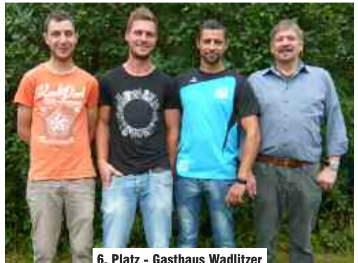
6. Platz - Gasthaus Wadlitzer