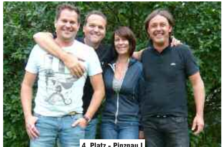
4. Platz - Pinzgau I