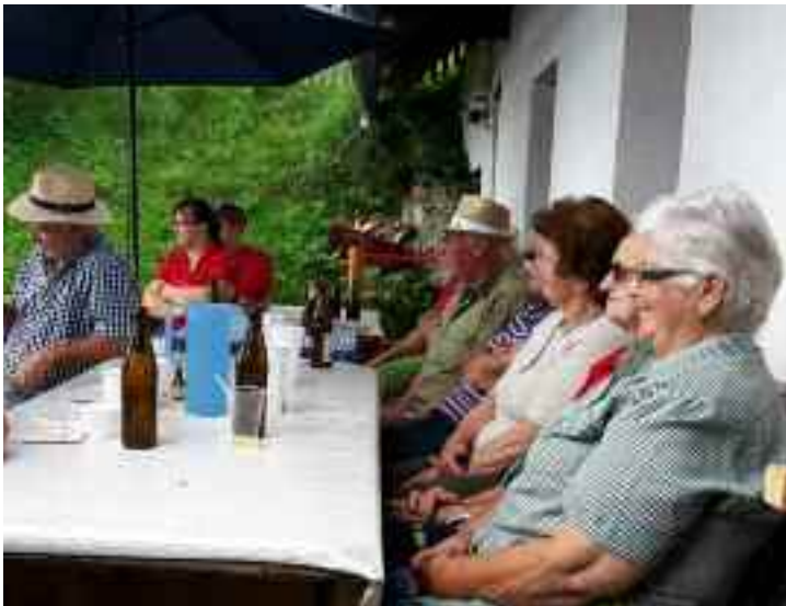
Gemütliches Beisammensein vorm „Mochanzer“