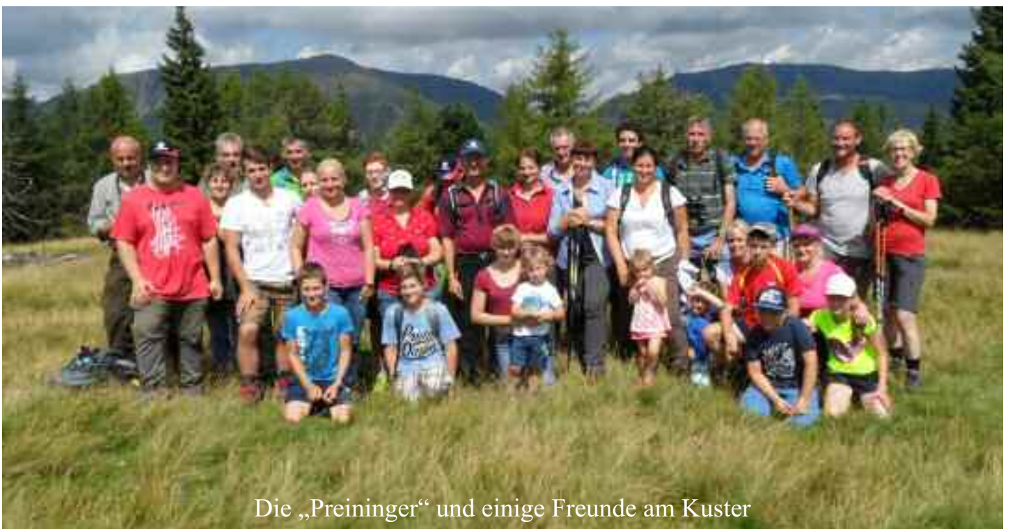
Die „Preinger“ und einige Freunde am Kuster