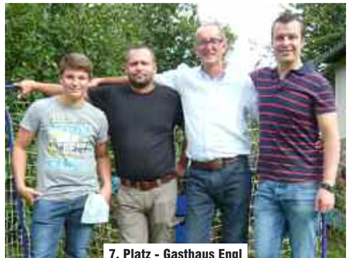
7. Platz - Gasthaus Engl