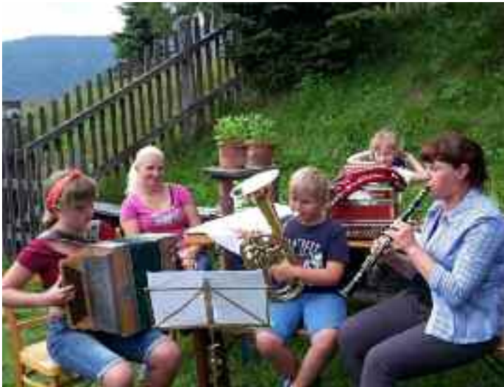
„Die Müller-Dirndl die Zweite“ (zweite Generation)