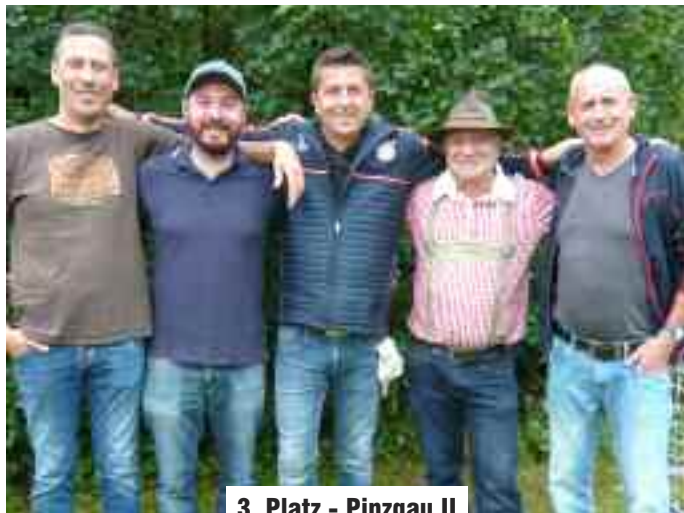
3. Platz - Pinzgau II