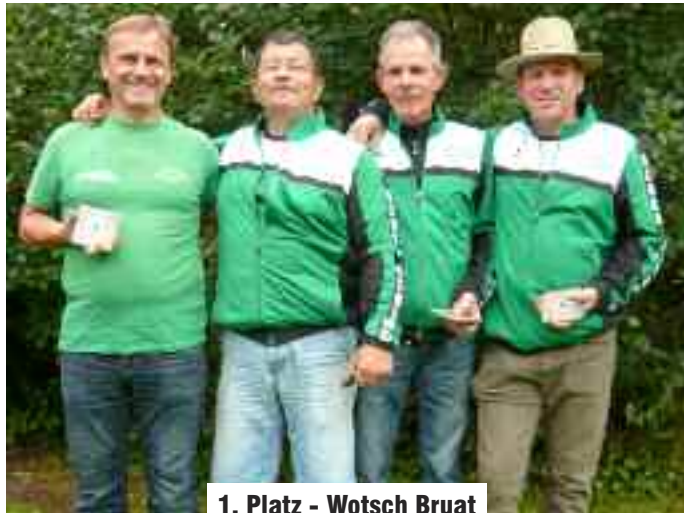
1. Platz - Wotsch Bruat