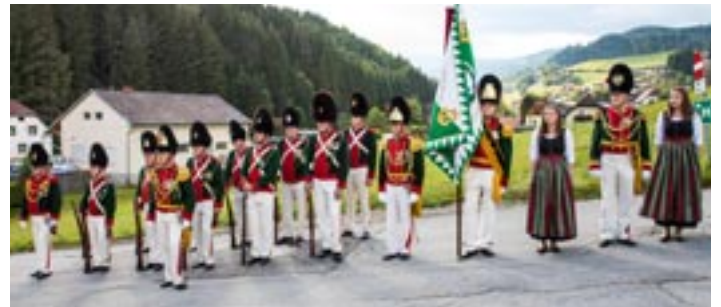
Auch die Garde war dabei