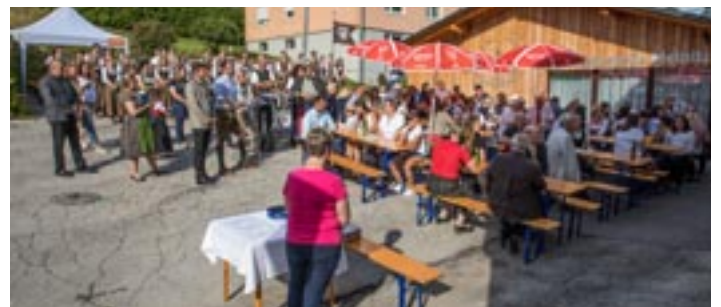
Viele Besucher und gemütliche Stimmung