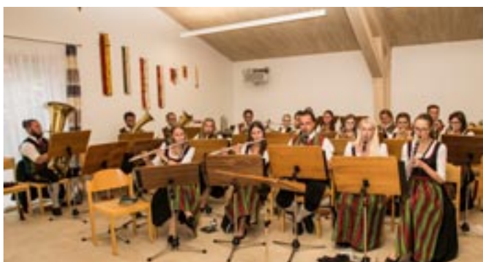
Der neue Proberaum