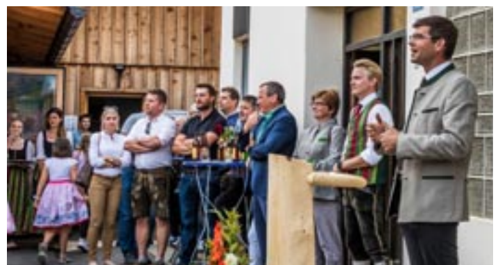
Die Prominenz war auch gekommen