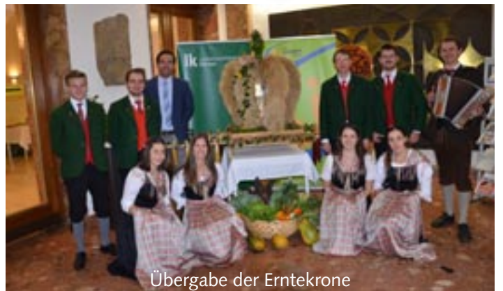
Übergabe der Erntekrone