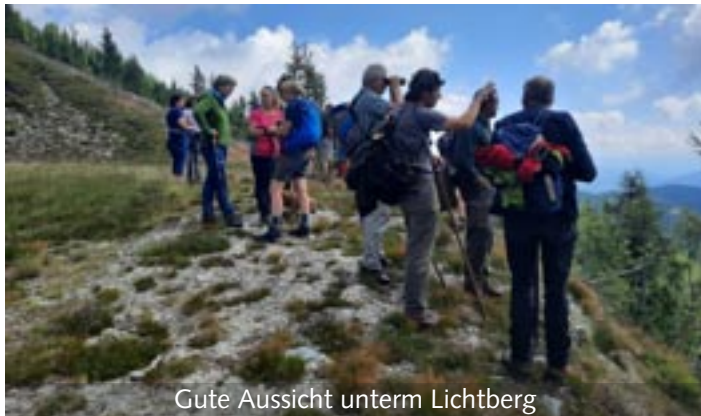
Gute Aussicht unterm Lichtberg