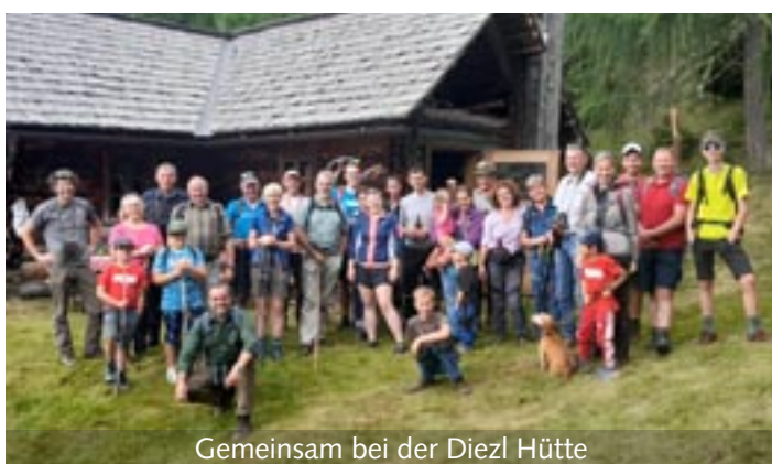
Gemeinsam bei der Diezl Hütte