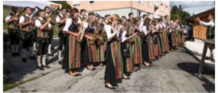
Konzert bei der Eröffnung