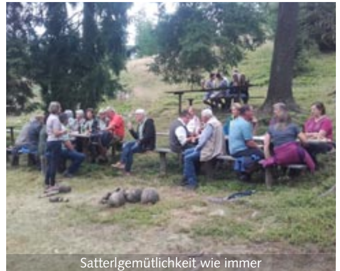
Satterlgemütlichkeit wie immer