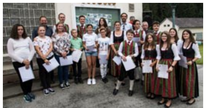
Die Jungen mit den Leistungsabzeichen