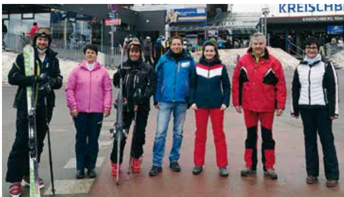
Vertreter der Gemeinde Murau und Teilnehmer am Schitag

lichen Betätigung von „Jung und Alt“ wieder gut angenommen. Jeder Teilnehmer erhielt auch einen Gutschein für einen Gastronomiebesuch am Kreischberg. Ein Danke dem Veranstalter von Seiten der Kärntner Teilnehmer.