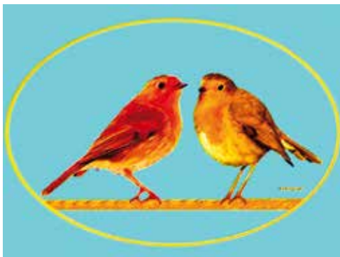
Zwei Rotkehlchen in für Menschen nachahmenswerter friedvoller Eintracht

Geist und Physis erbauenden, frühlingshaften Naturgenuss. Erbeten befreit von jedweden politisch geschönten, von steinreichen Rüstungskonzernen verführerisch verabreichten militarisierenden Rüstungskuss!