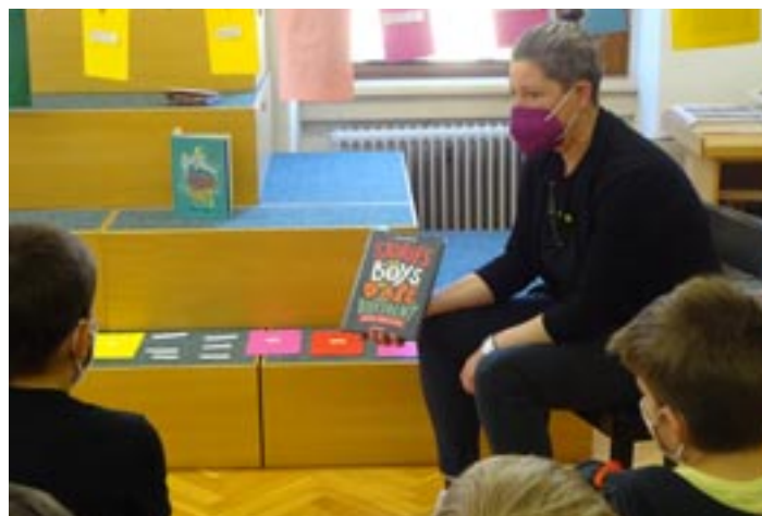
Buchvorstellung: "Stories for boys who dare to be different"