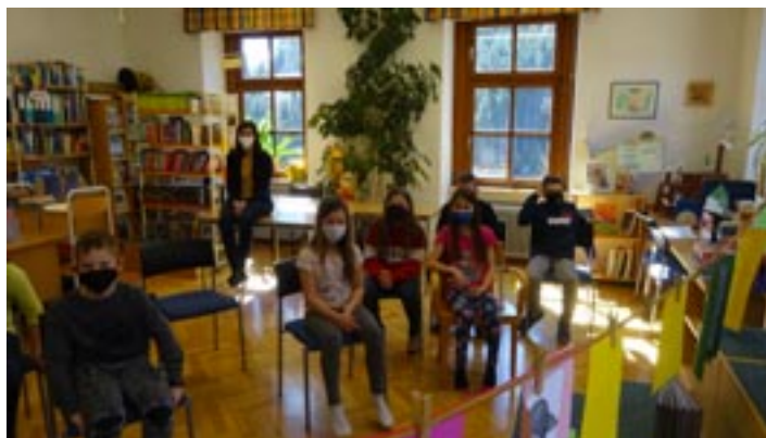
Schülerinnen und Schüler der 4a