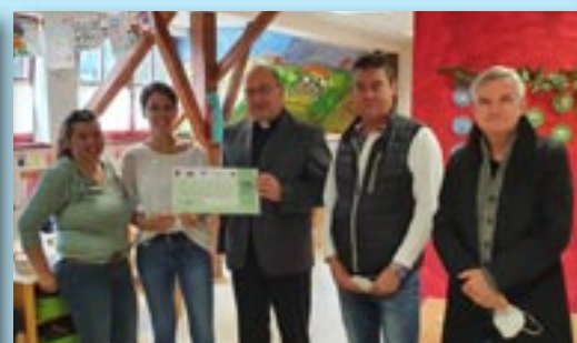
Der Pfarrkindergarten hat "MetnitzTaler" im Wert von 500 Euro erhalten!

Die Kindergruppe Gradeser Spatzennest freute sich über "MetnitzTaler" im Wert von 500 Euro!